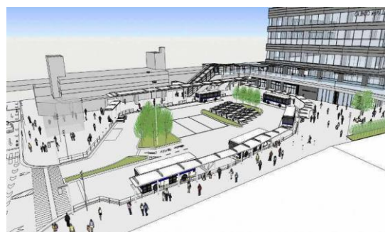
南口駅前広場イメージ