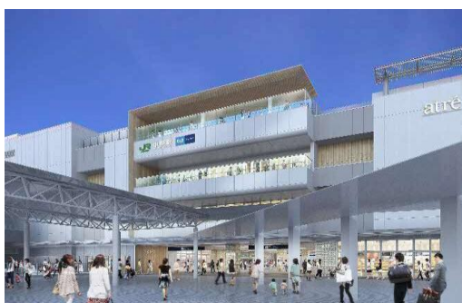
アトレ中野イメージ（新北口歩行者デッキより）