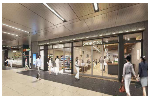
エキナカ店舗イメージ