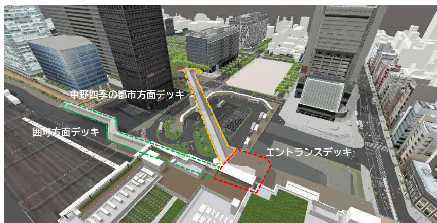
新北口駅前広場完成イメージ

さらに、周辺との連続性のある歩行者動線や一体感あるオープンスペース、みどりの確保を行うことで、「新しい中野の顔となる都市型複合交通ターミナル」を整備します。