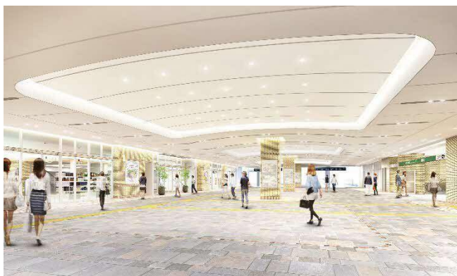
南北通路イメージ