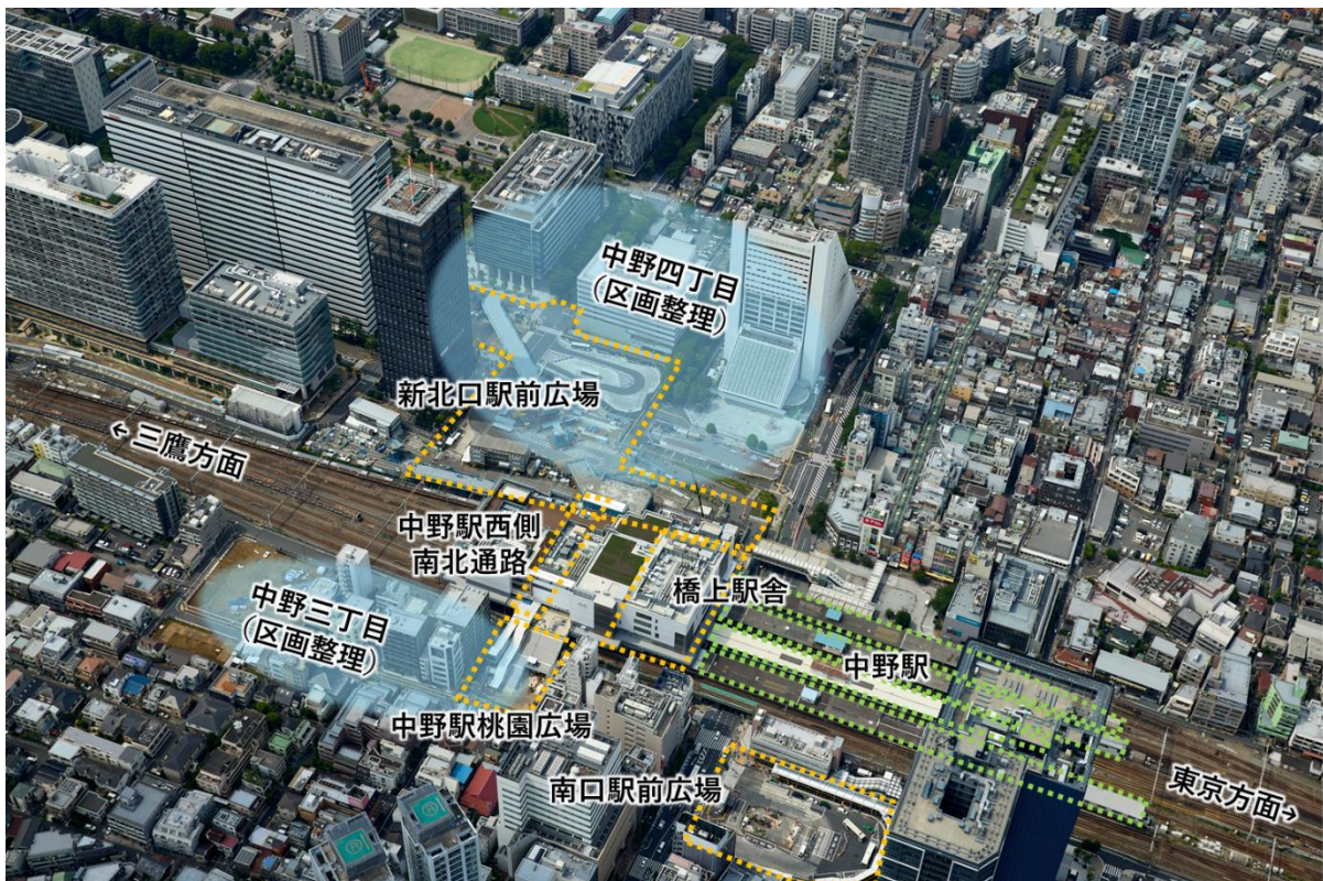
中野駅全景(令和8(2026)年6月撮影)