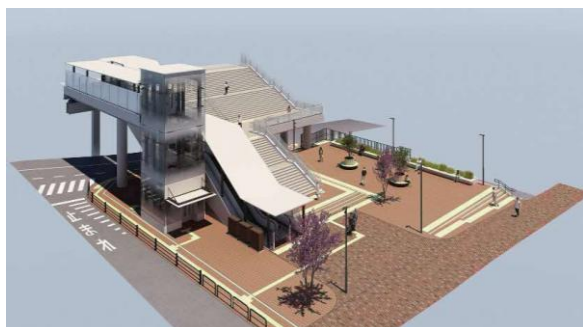
中野駅桃園広場イメージ