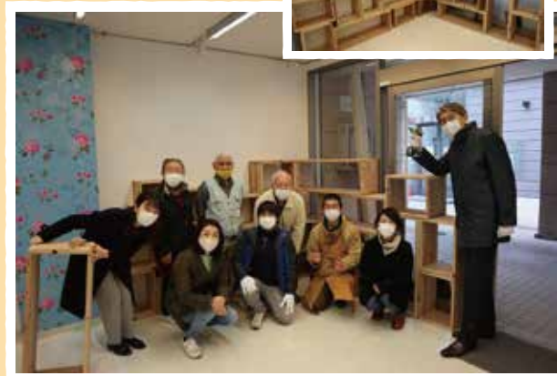
完成した棚の前でパチリ♪