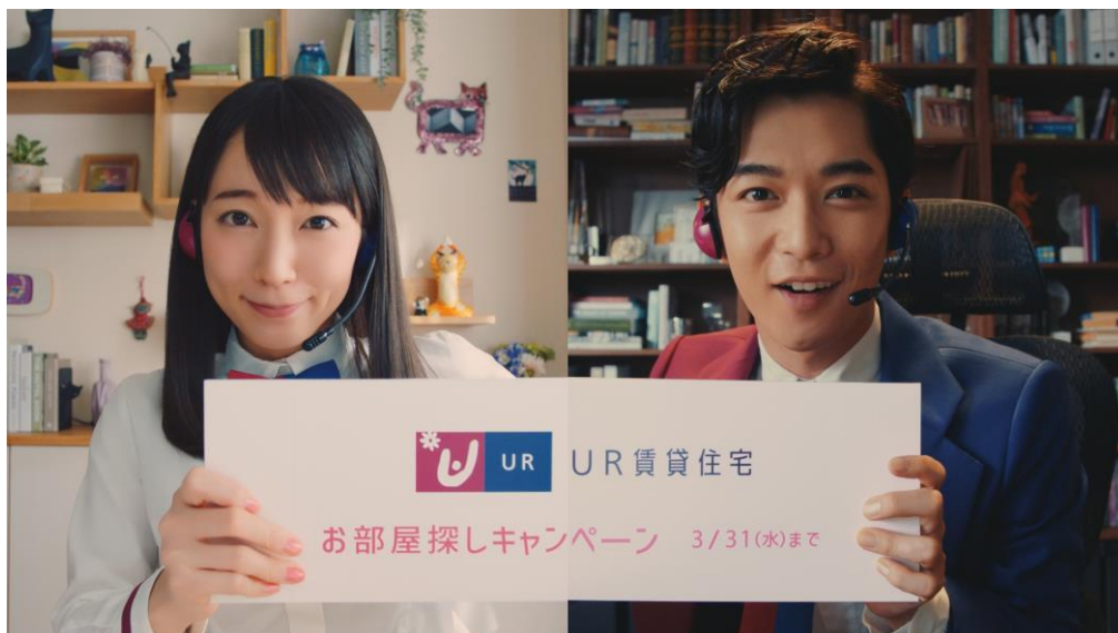
新TV-CM「テレワーク(礼金・仲介手数料ナシ)」篇より

URL: https://www.ur-net.go.jp/chintai/campaign/2021/spring/