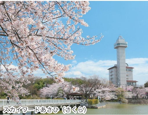
スカイワードあさひ (さくら)