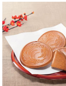
【みそ入大垣せんべい】