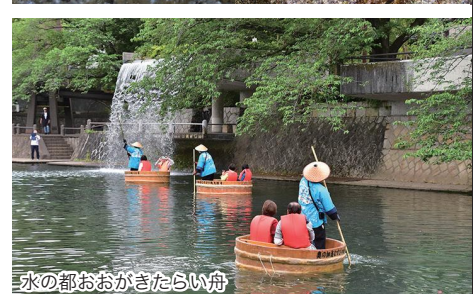
水の都おおがきたらい舟