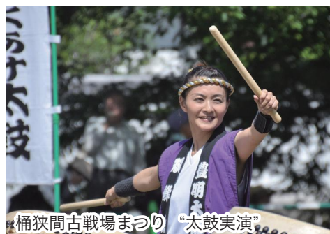
桶狭間古戦場まつり “太鼓実演”