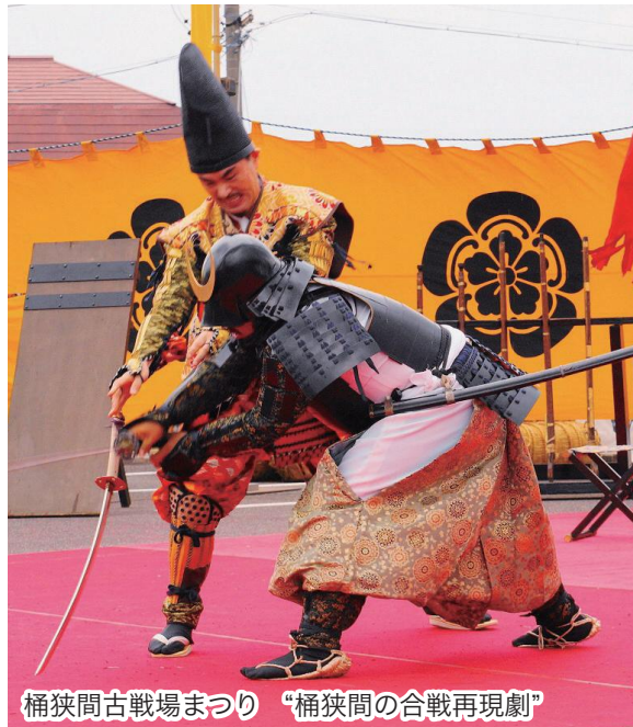
桶狭間古戦場まつり “桶狭間の合戦再現劇”