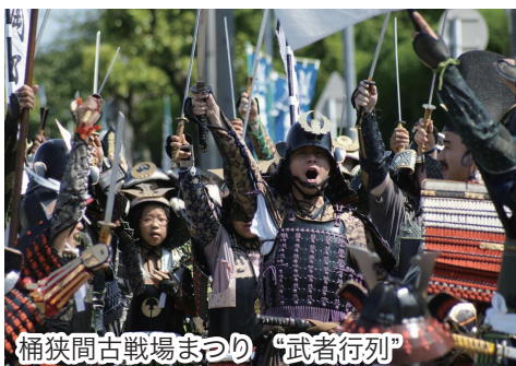
桶狭間古戦場まつり “武者行列”