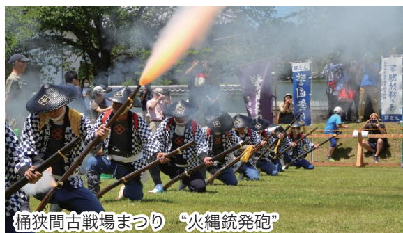
桶狭間古戦場まつり “火縄銃発砲”