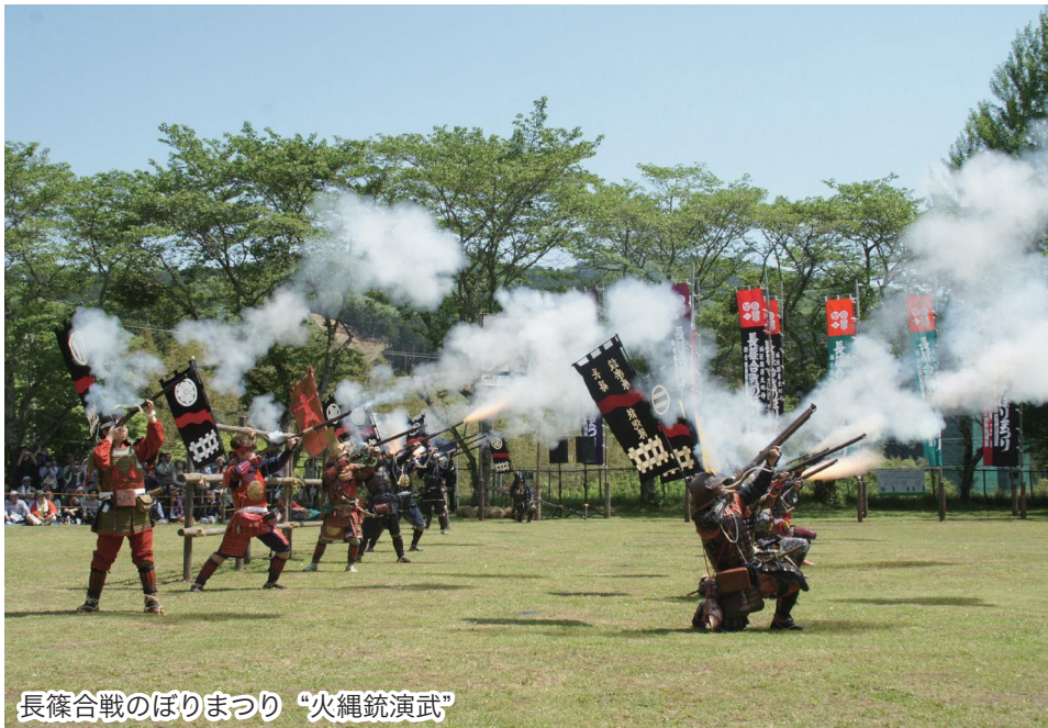
長篠合戦のぼりまつり “火縄銃演武”