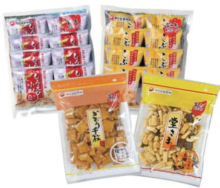
富山柿山 お楽しみ袋