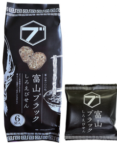
富山ブラック しろえびせんべい