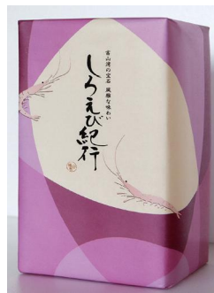
しろえび紀行 11袋入 / 16袋入