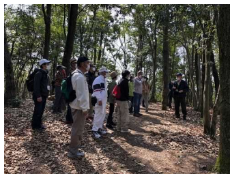
ガイドが高森山の 自然を説明