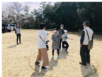
ネイチャーゲームで 楽しく自然を学ぶ