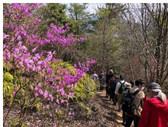
ツツジの咲く 散策路を満喫