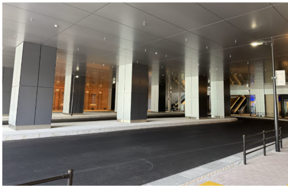
令和8年3月25日に供用開始した交通広場