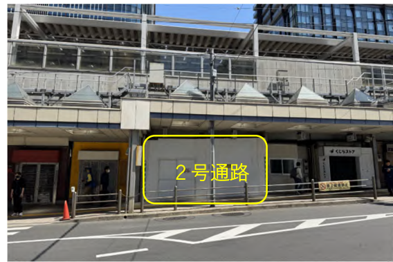
令和8年12月頃に供用開始予定の歩行者専用2号通路

本事業で整備し、令和8年3月25日に供用開始した交通広場では、タクシー乗り場の運用が開始され、交通結節点としての機能向上が進んでいます。