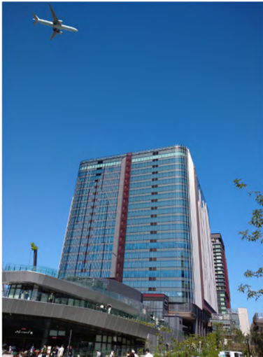
多くの来訪者で賑わう「OIMACHI TRACKS」

独立行政法人都市再生機構（以下、UR都市機構）が大井町駅周辺で施行している「広町二丁目土地区画整理事業」（以下、本事業）において、東日本旅客鉄道株式会社（以下、JR東日本）および東急電鉄株式会社と連携し、整備を進めてきた東急大井町線高架下の歩行者専用通路（歩行者専用4号通路。以下、4号通路）が、令和8年6月30日（火）に供用開始します。