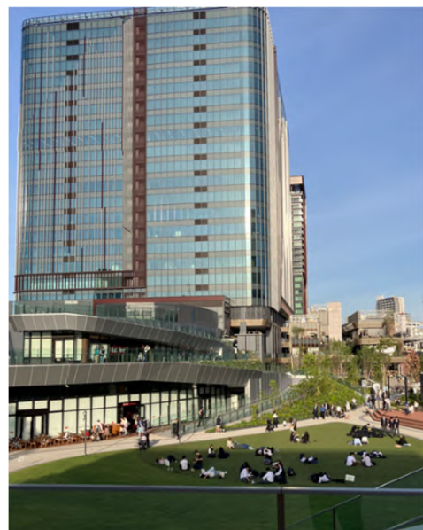
憩いと賑わいを創出する「TRACKS PARK」

「TRACKS PARK」は、地域をつなぐ核として、平時は憩いと賑わいを創出する広場空間として、災害時は行政機能ゾーンやしながわ中央公園と連携した地域の防災拠点となる空間を形成しています。