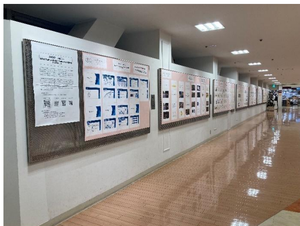
〈昨年度のせいせきS Cでの作品展示の様子〉