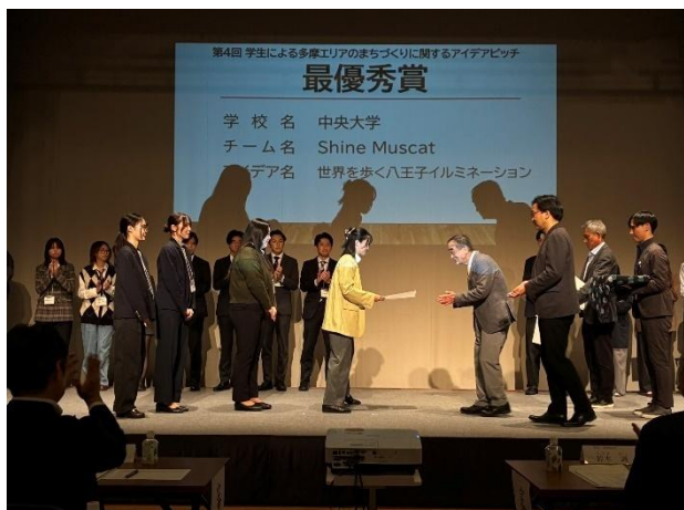
〈昨年度の表彰式の様子〉