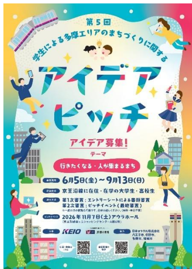
〈ポスタービジュアル〉

2022年度から高校では探究学習が必修化し、大学においても課題解決型学習の機会が増加しています。本企画は、このような背景を踏まえ京王電鉄が行ってきた授業支援の経験を活かしたテーマ設定としています。