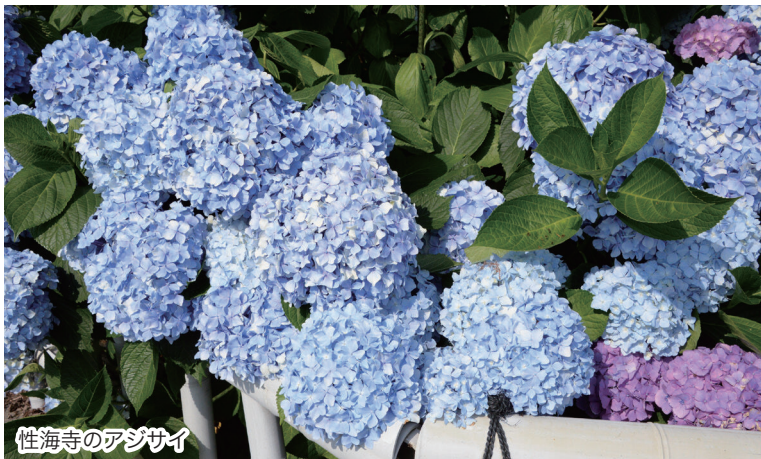
性海寺のアジサイ