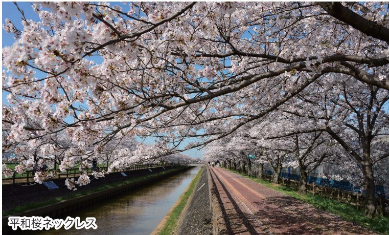
平和桜ネットワークス