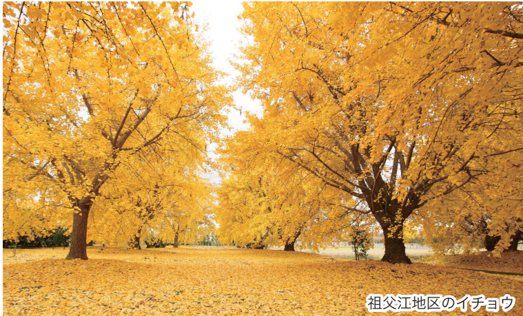
祖父江地区のイチヨウ