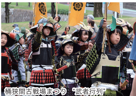
桶狭間古戦場まつり “武者行列”