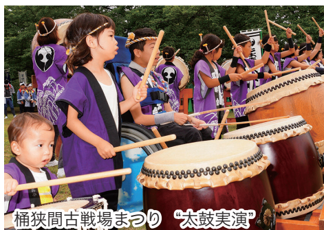
桶狭間古戦場まつり “太鼓実演”