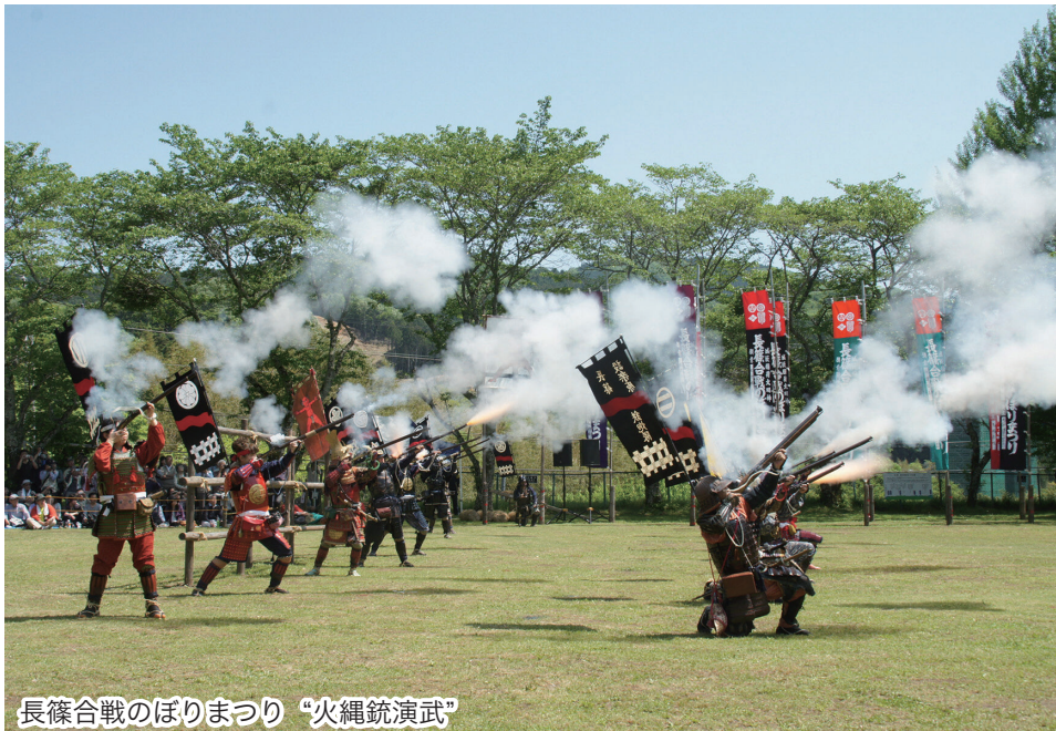
長篠合戦のぼりまつり “火縄銃演武”