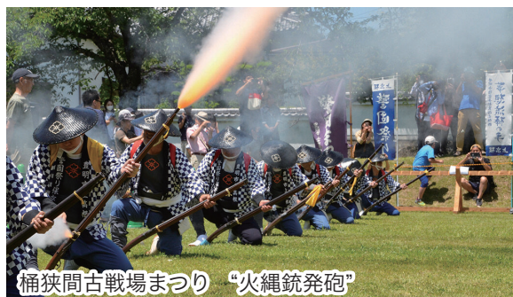
桶狭間古戦場まつり “火縄銃発砲”