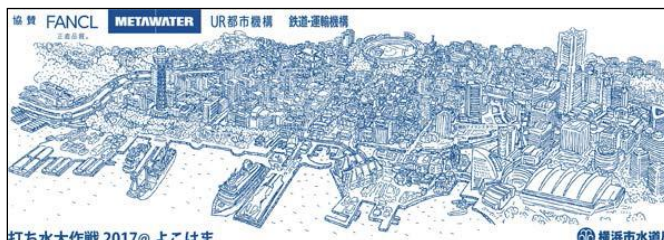
打ち水大作戦 2017@よこはま オリジナル手ぬぐい

ご参加いただいた方に開催場所の入ったオリジナル手ぬぐいの他、お子様には 色鉛筆、メモ帳など両機構のグッズもプレゼント。