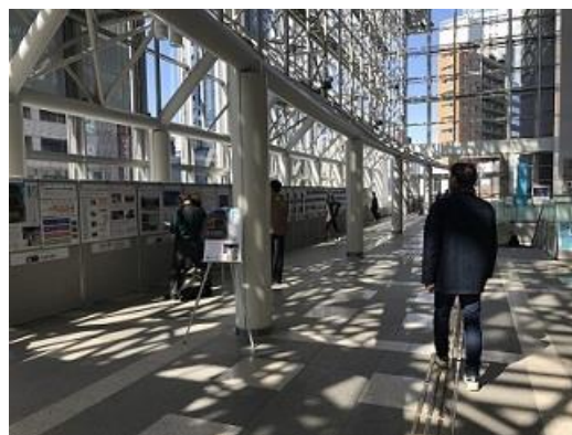
＜過去の作品展の様子＞