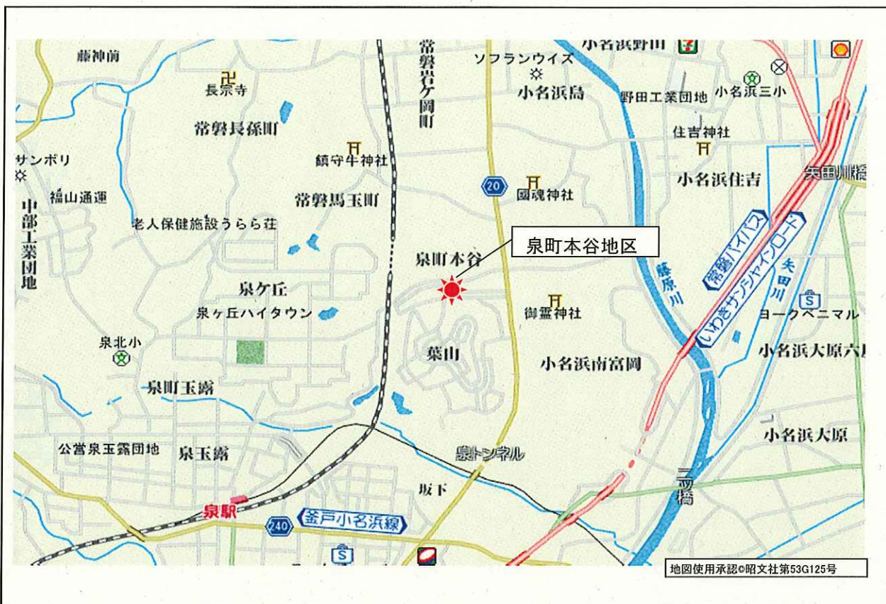
位置図 地区名 いわき市泉町本谷地区復興公営住宅