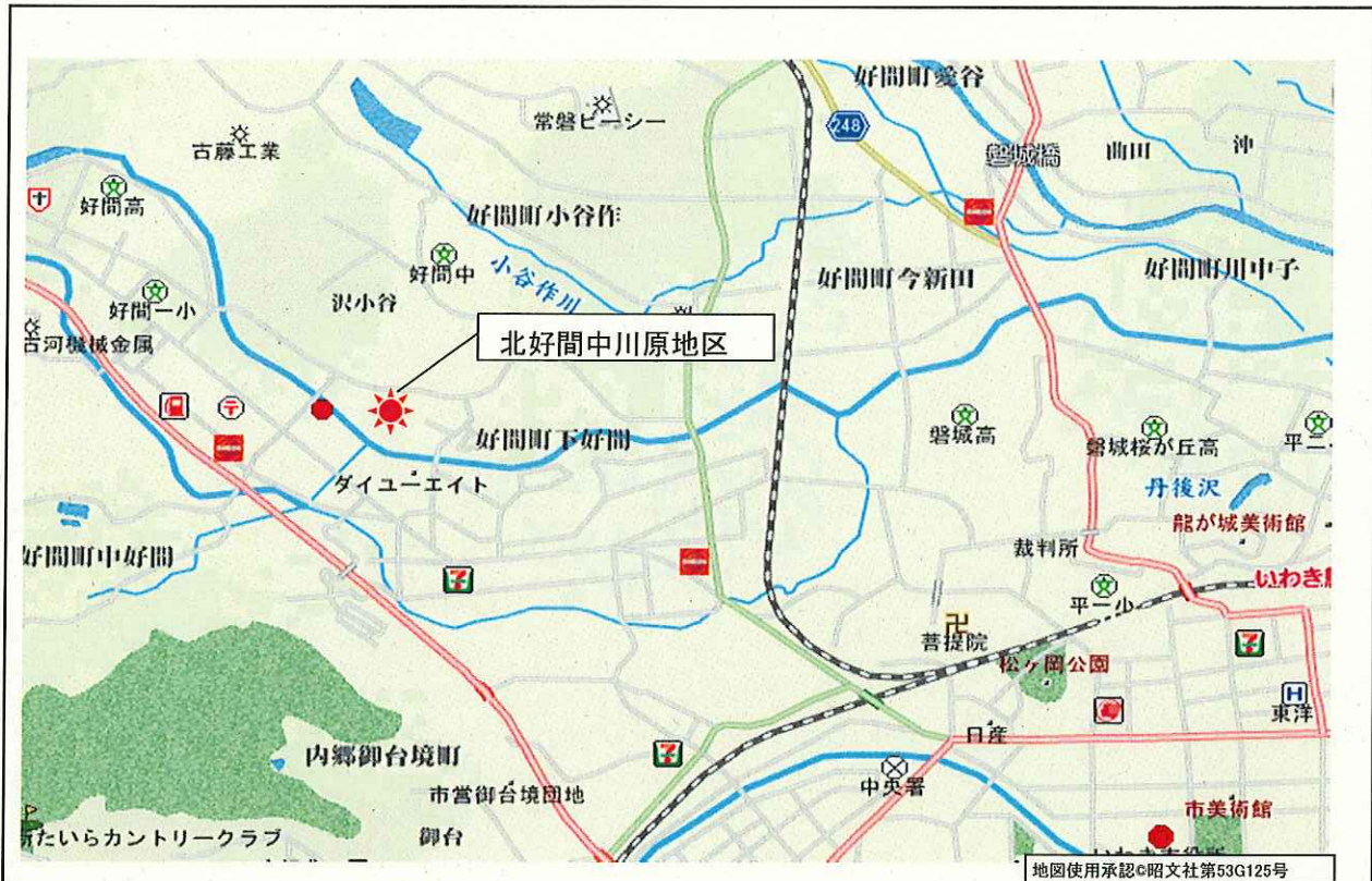
位置図 地区名 いわき市北好間中川原地区復興公営住宅