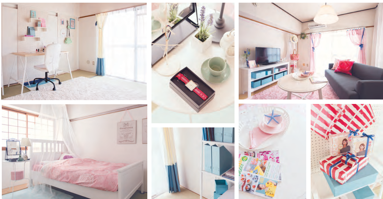
〈ルームコーディネートイメージ〉

1996年6月3日生まれ 福岡県出身。 モデルやタレントとして CMやTVなどで幅広く活躍 中。週刊ヤングジャンプ No.26号(2016年05月26日 発売)で、同誌史上初の五冠 (初登場、初表紙、初水着、 初巻頭、初巻末)を達成する など、今後の活躍が期待さ れているモデルのひとり。