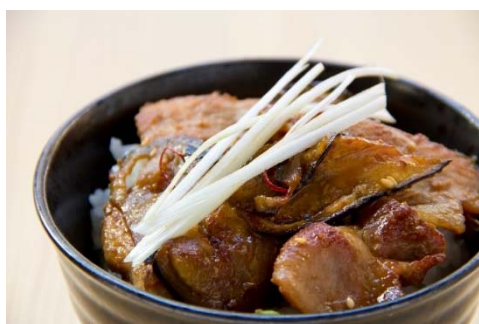
メニューはボリュームたっぷり「豚丼」

このたび、その延長として、子ども食堂の考え方をベースにして、「星の原カフェ」の終了後に、星の原団地町内会の主催により、高齢者やこどもたちの孤食を予防し、楽しいひと時を過ごしていただくことを目的に、「星の原やすらぎ食堂」を試行的に開店することとなり、当機構も協力させていただくことになりました。