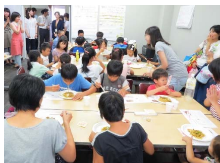
大人もこどもにぎやかに（香椎若葉団地での例）

当日は、食事の提供の他、学習支援（夏休みの宿題のお手伝い）や TSUTAYA による古本図書館など、大人もこどもも参加できる楽しくて役に立つ企画を予定しており、また「星の原カフェ」においても、特別企画として、そば打ちの実演、提供を行います。