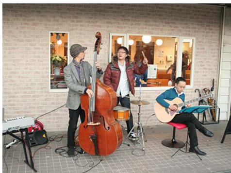
K I C H I カルテット (今回はピアノ・サクソ・ベース・ドラムです)