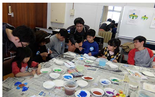
「イロトリ鳥」製作中の様子