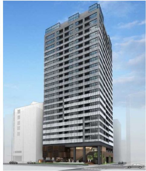
UR賃貸住宅「横浜ヴェールタワー」