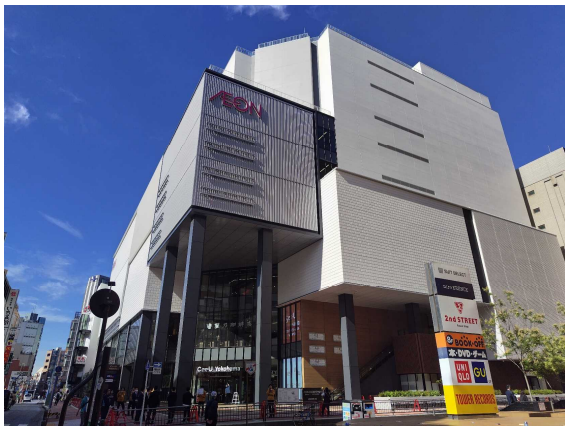
横浜ヴェールスクエアCeeU

商業施設は、イオンモール株式会社が賃借し、「CeeU Yokohama」として営業を始めます。令和5年（2023年）10月27日には、1階にイオンフードスタイル横浜西口店とイオン銀行が先行オープンします。同年12月15日には施設全体がグランドオープンを迎え、この地域の象徴的なロゴデザインもお披露目されます。