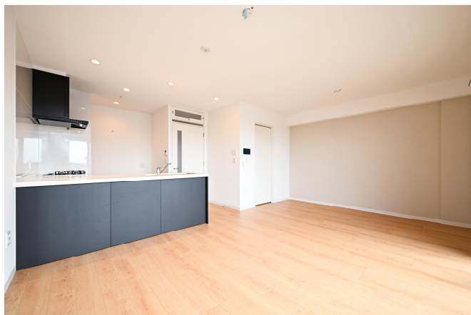
2LDK-69 m 2 (1012 号室)ナチュラル×ブラック