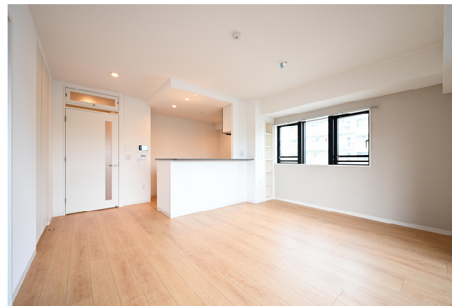
3LDK-75 m 2 (201 号室)ナチュラル×ブラック