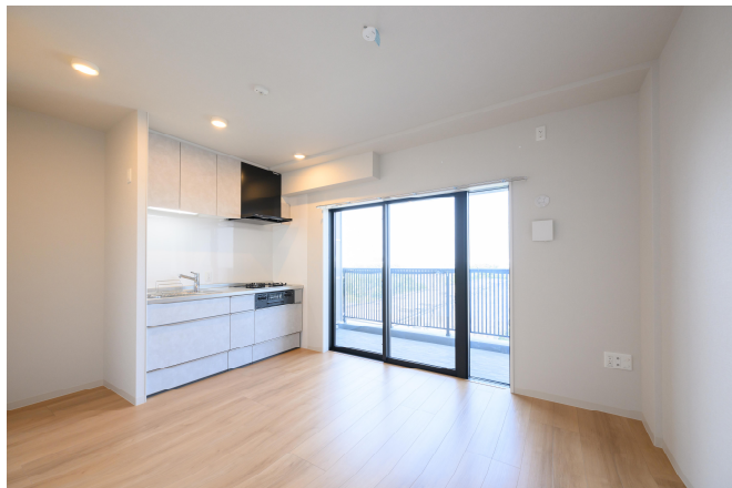
1LDK-40 m 2 (721 号室)ライトグレイージュ