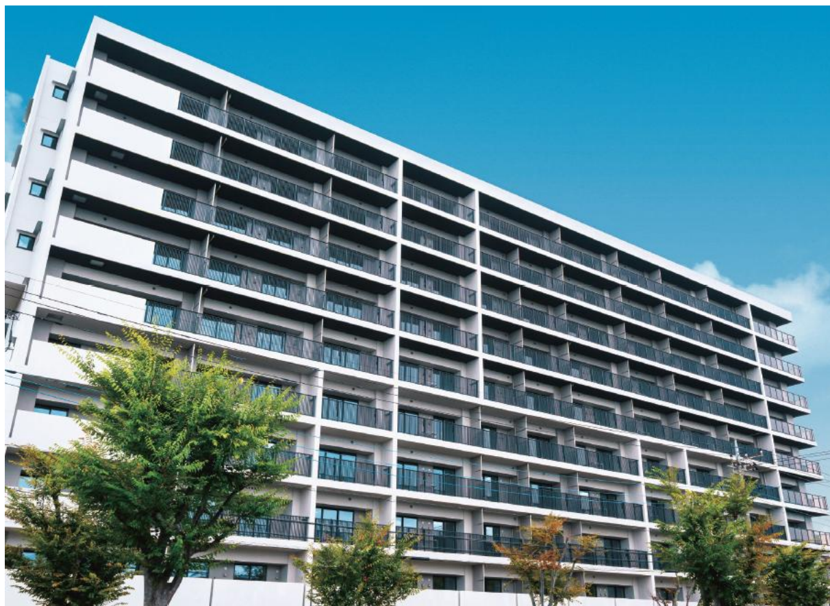
コンフォール西浦和田島〈第1次〉 外観写真

独立行政法人都市再生機構（以下「UR都市機構」）は、新築賃貸住宅の入居者を別紙の要領で募集いたします。