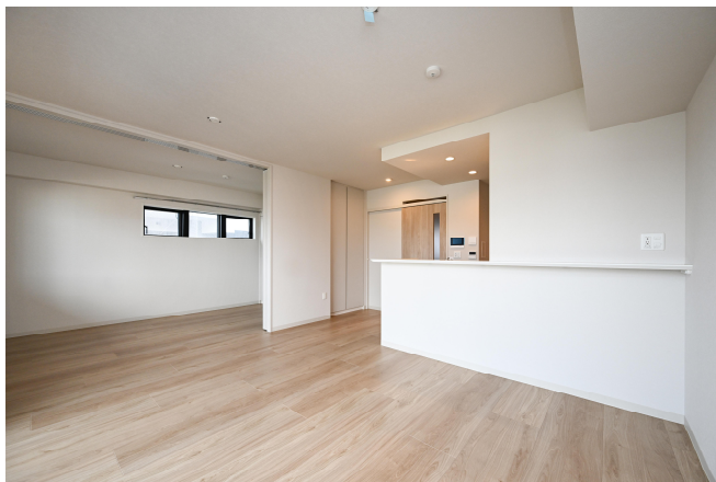
2LDK-61 m 2 (506 号室)ダークグレイージュ