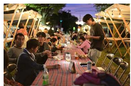
にわジャム 2019 夜にはバルも開催