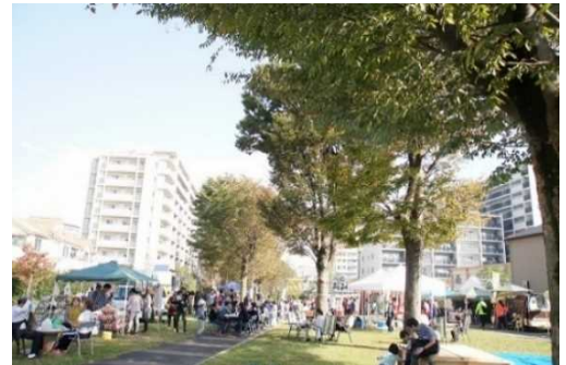
イベント時のひばりが丘西・東けやき公園の様子

詳細・申込方法: https://machiniwa-hibari.org/blog/tour/