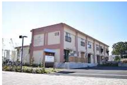
ドラマ撮影にも使用された ひばりテラス 118