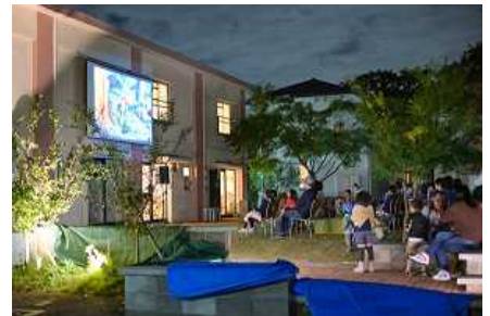
ひばりテラス 118 の芝生で 映画イベントを開催