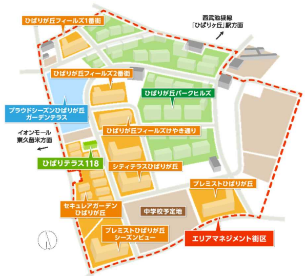
「ひばりが丘団地の団地再生事業」の建替えエリア

一方、地域の魅力が将来にわたり向上していくまちづくり・まち育てを進めていくため、建替えによって生み出された敷地には、公共・公益施設や分譲マンションを整備しました。分譲マンションエリアでは、エリア一体のコミュニティ形成を目的に、開発からエリアマネジメントまで継続的にまちづくりに関与する事業パートナー(大和ハウス工業・コスモスイニシア・オリッス不動産の共同企業体(以下、大和ハウス工業グループ)、住友不動産、野村不動産)を募集し、官民共同でまちづくりを行ってきました。