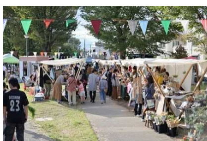
にわジャム 2019 昼のマルシェの様子