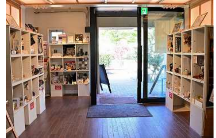
ひばりテラス 118 内ハンドメイド雑貨ショップ