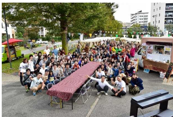
「まちにわ ひばりが丘」事務局と地域住民

まちにわ ひばりが丘は、東京都西東京市・東久留米市における独立行政法人都市再生機構(以下「UR 都市機構」)による「ひばりが丘団地再生事業」に参画する大和ハウス工業株式会社・住友不動産株式会社・株式会社コスモスイニシア・オリックス不動産株式会社の4社とUR都市機構による連携のもと、継続的なエリアマネジメントの実現を目的に、2014年に設立された一般社団法人です。