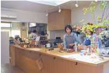
ひばりテラス 118 内カフェ