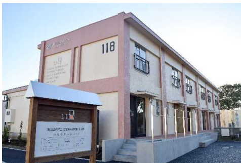
既存のテラスハウスを活用した まちにわ ひばりが丘事務局 「ひばりテラス 118」

「まちにわ ひばりが丘」は、住民の交流・懇親活動を行い、住民同士が協力し合い、安心して、学び、自然を楽しむ暮らしを送ることを推進するために 2014 年 6 月に設立されたエリアマネジメント団体です。