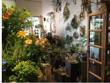
ひばりテラス 118 内フラワーショップ