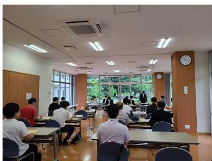
「まちにわ ひばりが丘」総会の様子

「ひばりが丘団地再生事業」は、地域のまちづくりからエリアマネジメントまでを官民共同で取り組む「事業パートナー方式によるPPP(パブリック・プライベート・パートナーシップ)手法」を取り入れた 日本初の試み です。