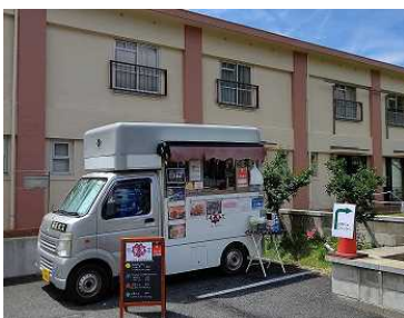
ひばりテラス 118 にキッチンカーが登場

2019 年 10 月 26 日・27 日に「まちにわ ひばりが丘」の活動拠点である「ひばりテラス 118」オープン4周年を記念したイベント「にわジャム 2019」を開催いたしました。