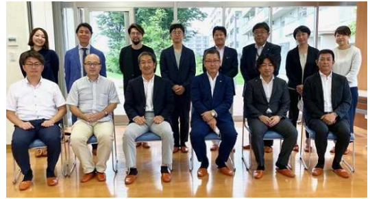
「まちにわ ひばりが丘」新旧体制