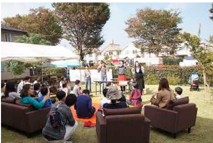
ひばりテラス 118にて 子ども向けイベントを実施