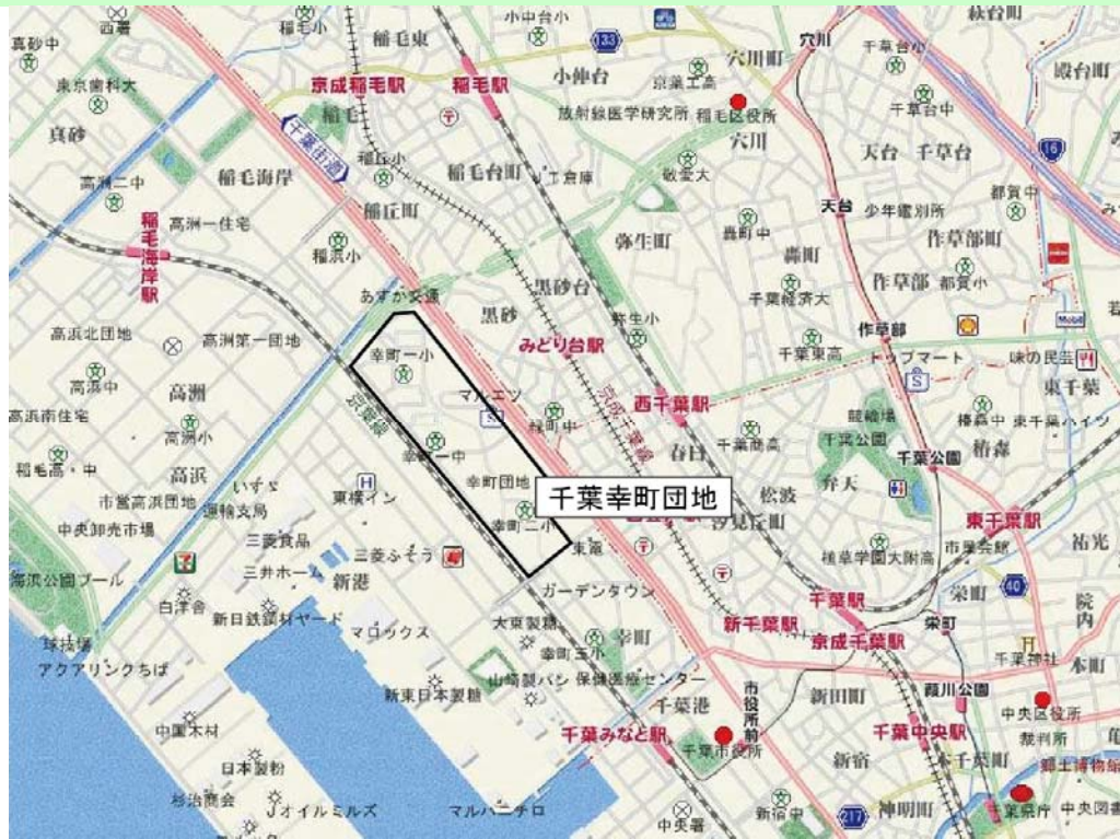
「地図使用承認・昭文社第 56G107 号」