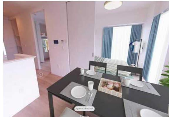
3LDK-65 m 2 (18号棟 1001号室)