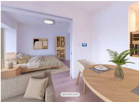
2LDK-67 m 2 (18号棟 106号室)