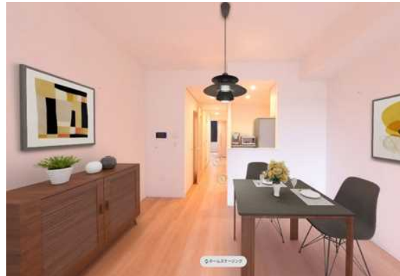
1LDK-51 m 2 (18号棟 103号室)