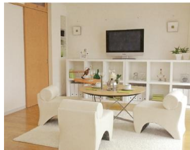
バリアフリー化された 多彩な住戸プラン