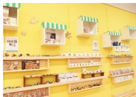
「みさとのおみせ mi*akinai」で展示販売されている