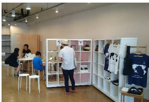
「みさとのおみせ mi*akinai」施設内の様子