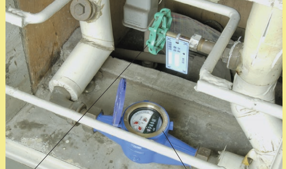
Van khóa nước

Khi bị rò rỉ nước hay trường hợp đi vắng trong thời gian dài thì xin hãy đóng van khóa nước này lại.