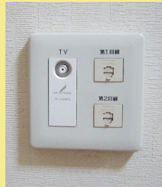
모듈러잭 (사진은 2회선을 사용할 수 있는 주택의 경우)