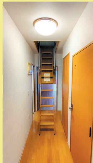
천장 수납 공간