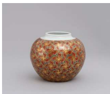
富本憲吉 《色絵金銀彩四弁花模様飾壺》 1960年 H23.0cm