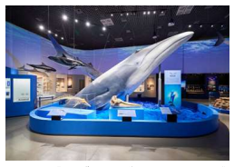
《ナガスクジラ上半身標本》 東京展の様子