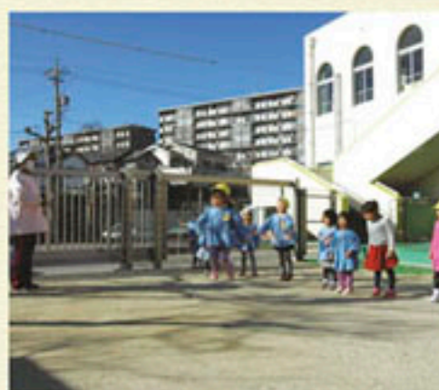
縄跳びもこんなに上手になりました

同園の保育の柱は3つの「育」。遊びを通して育つ「遊育」、年齢を超えて共に育つ「共育」、そして食育です。遊育については、東郷町との連携でコーディネーショントレーニングを取り入れた運動遊びを行っています。その他にも伝承遊びやリズム遊びなどを通して、様々な運動能力を育てながら体づくりをしています。「小さい頃から運動の楽しさを知ると、体を動かす習慣が自然に身に付く。それが健康長寿につながります」。保育は今だけでなく、未来にもつながっていると納得できました。