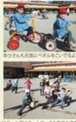
ドッジボールではチームワークも生まれます