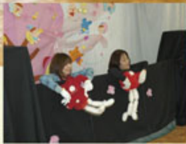
熱演する保育士さん