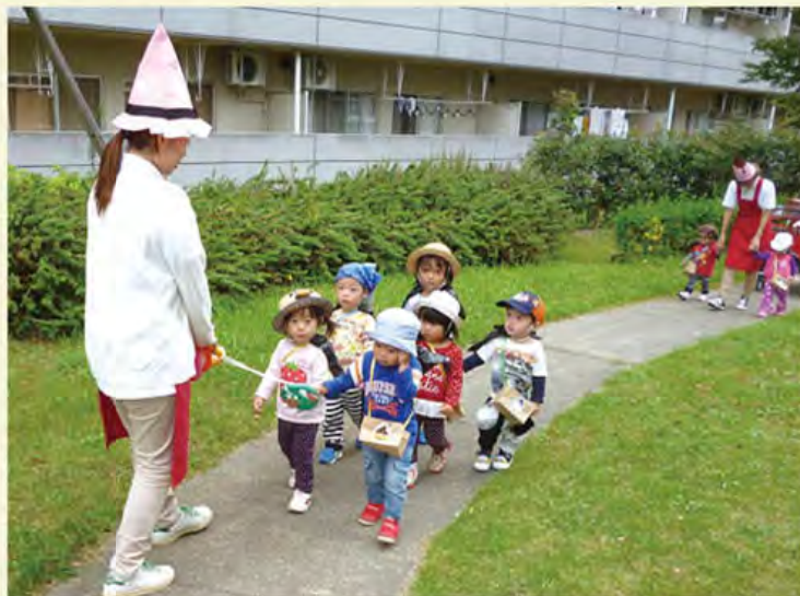
敷地内を散歩する子どもたちを住民も微笑しく見守ります