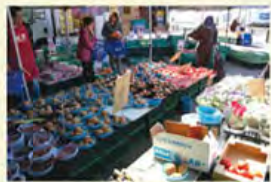
活気あふれる「果菜」店内

子育て環境、 文化活動、生活 利便性。様々 な素敵にあふ れたUR団地 でした。 「素敵生活 ナイス!UR」 ハガキにお住まいのUR団地の素敵の理由を お書きください。最終ページの応募先にお送り ください。取材ポイントを書いた上、採用の方 には筆頭選定いたします。