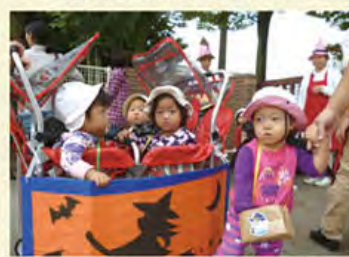
ハロウィンパーティー