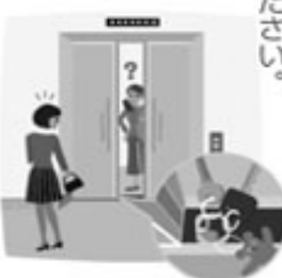
ミゾを詰まらせないで

安全のため、扉が閉まらない とエレベーターは動きません。 ゴミや小物などを落として敷居 のミゾを詰まらせないようにし てください。