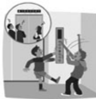
乱暴な操作はしない

扉をたたくなど乱暴な操作は エレベーターの誤作動、閉じ込 めや故障の原因となります。ま た、必要なボタンを操作する と他の利用者への迷惑ともなり ます。