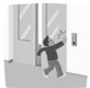
手の引き込まれに注意

不注意やイタズラなど、お子 さまの行動が思わぬ事故や故障 を引き起こすことがあります。 また、停電などのアクシデント が発生した場合、お子さま1人 では対応が困難になる可能性が あります。必ず保護者の方が付 き添ってご利用ください。