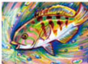
「無題」 名古屋市守山 イカスミ