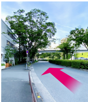
① 前方に見える歩道橋を越えます。