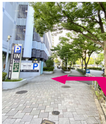
② 歩道橋を越えてすぐ左手に見える駐車場になります。