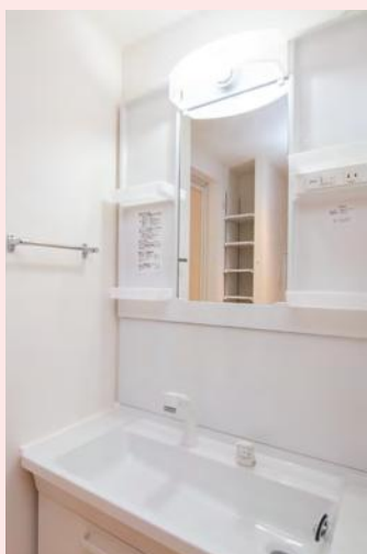
洗髪機能付洗面化粧台