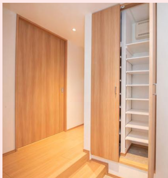
玄関(上り框)・玄関収納