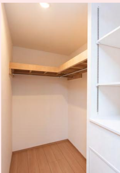
ウォークインクローゼット