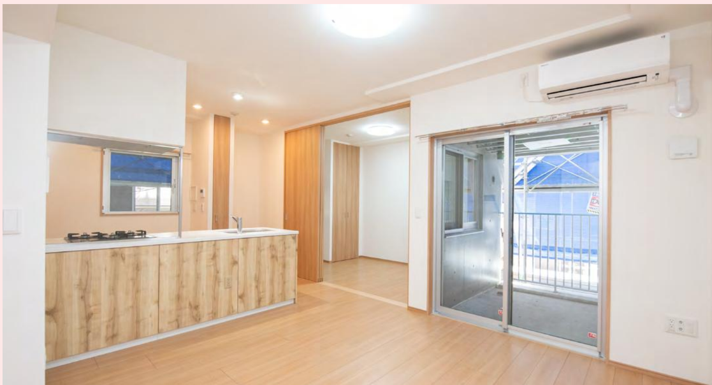
リビング・ダイニング・キッチン