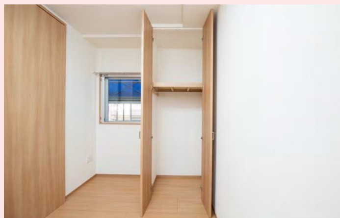
洋室(2)・クローゼット