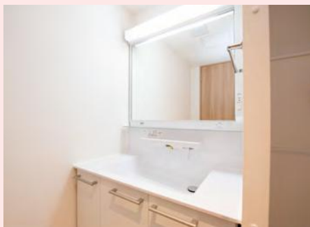
洗髪機能付洗面化粧台