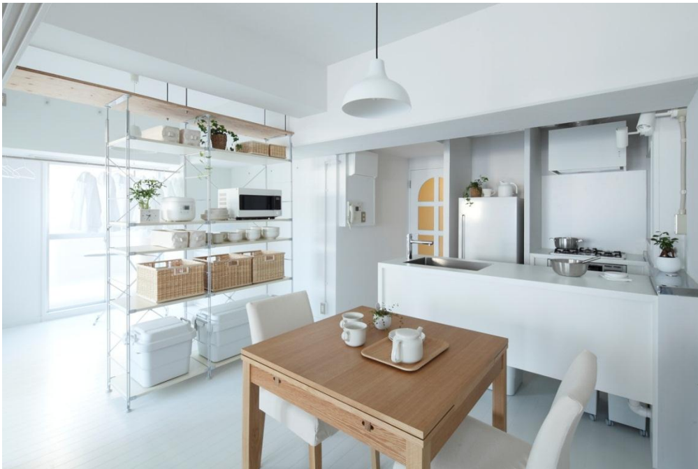
(名古屋市中区 アーバニア千代田団地 プラン Re+018)

(*)「MUJI × UR団地リノベーションプロジェクトについては、別添をご覧ください。