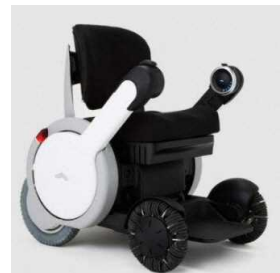
自動運転車椅子イメージ

名古屋大学が開発した石尾台地区内の自動運転カートに導入されている自動運転車用ソフトウェア「ADENU」 ※2 を車椅子に適用し、より快適な移動の実現に向けた歩行者支援の可能性を検証します。