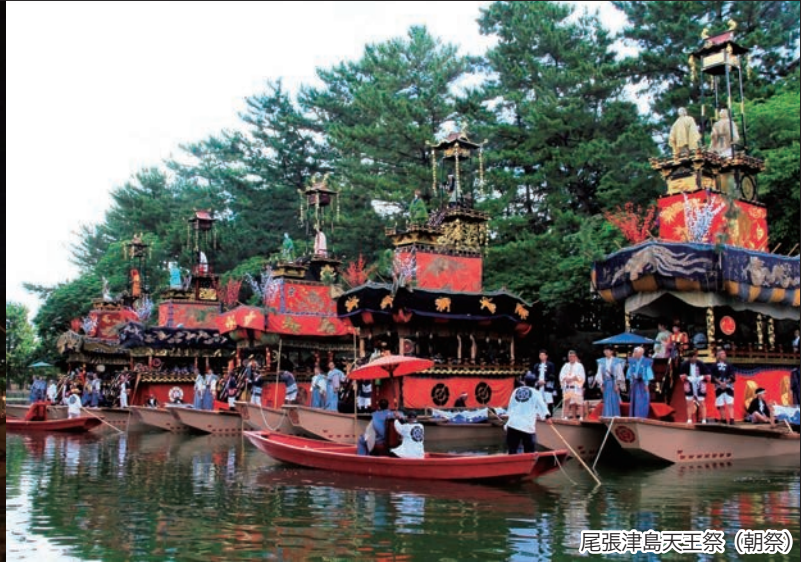
尾張津島天王祭 (朝祭)