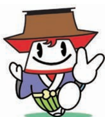
津島市公式キャラクター つし丸