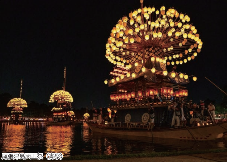
尾張津島天王祭 (宵祭)