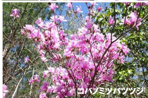
コバノミツバツツジ