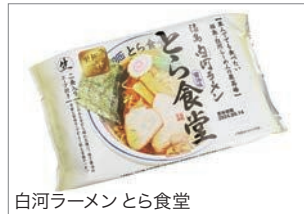
白河ラーメン トラ食堂