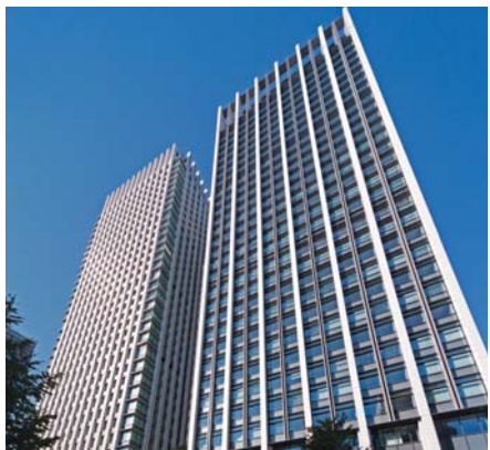
第 2 次再開発事業施設建築物（大手町フィナンシャルシティ）

●大手町土地区画整理事業 施行面積：約 17.4ha 事業期間：平成 18 年度～平成 41 年度