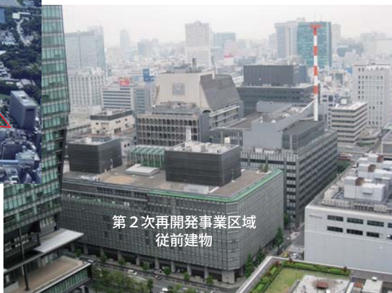
第 2 次再開発事業区域 従前建物