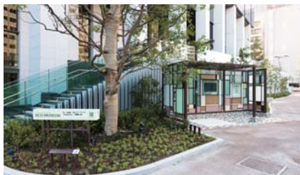
「エコ」の情報発信スペース、エコミュージアム