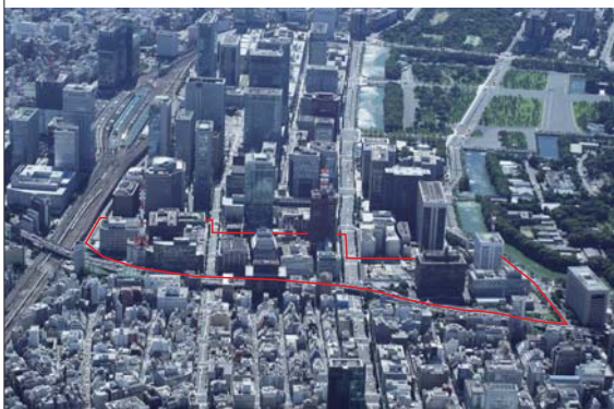
大手町地区（平成 18 年 4 月）