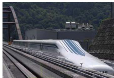
実験線を走行中のリニアモーターカー