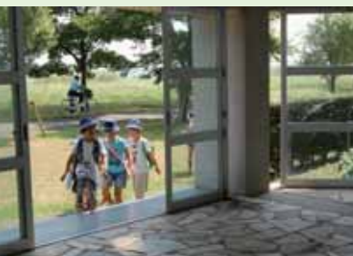
荒川の広大な河川敷に面した団地の施設に子どもたちが三々五々集まってくる

「ハートアイランド新田学童クラブ」。広い室内には50人を超える子どもたち。静かになったかと思うと、床に座って宿題に励む。20分もすると思いのグループで遊び始めた。その姿は、兄弟姉妹に恵まれた大家族の暮らしの風景にも見える