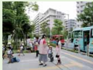
近隣の幼稚園と提携して運営する「幼稚園送迎ステーション」。送迎と保育の様子