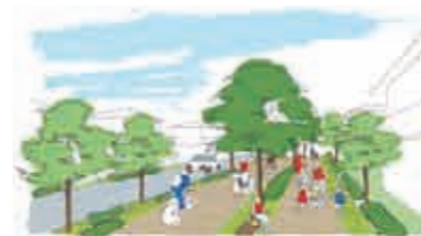
ベビーカーのために十分な幅がとられた歩道。車や自転車を通るエリアが分かれているので安心です。

みちひろば (家の前のみちの工夫) 身近なところに子供を安心して遊ばせられる場所が欲しいそんな声から、住宅地内の道路を一部広げてひろばのようにした「みちひろば」をつくりまします。近所の目が行き届くことや住民以外の車が入りにくい工夫で子供たちの安全を守ります。