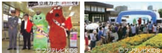
千葉ニュータウン中央駅の一駅長に就任したガチャピン・ムック BIGHOPと中央駅前の2つのステージでは様々なショーが行われ大盛況

成田スカイアクセス開業記念として、7月17日(土)・18日(日)に『サマーフェスタ2010』が開催されました。千葉ニュータウン中央駅前特設会場、BIG HOPガーデンモール印西、北総花の丘公園などの会場を連絡する無料の巡回バスが運行され、テレビの人気者ガチャピン・ムックの一日駅長や、バンジートランポリン、ミニ動物園、フリーマーケットなどなど、多彩な催しが繰り広げられました。6万3千人が来場し、盛り上がった2日間でした。