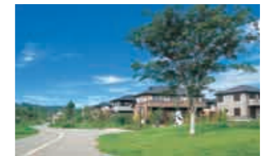
緑豊かで、生活環境・地球環境にやさしい住宅地