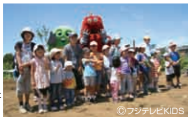
参加した子供たちとガチャピン・ムックによる記念撮影

子供たちが毎日食べている野菜が、どのような環境で、どのように育てられているのか、眼で見て体験もできる場所を提供しようと生まれたのがBeポンキッキ農園です。サマーフェスタ開催中の7月17日(土)、はじめてトモロコシの収穫祭を実施しました。おなじみのGGマイク、ガチャピン・ムックも参加、みんなで収穫のあと、この農園と印西市で採れた新鮮な野菜たっぷりの特製“おむすびベジカレー”の試食も行われ、会場は子供たちの喚声に溢れました。