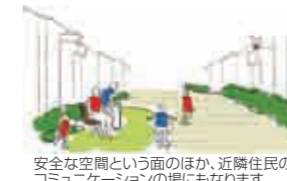
安全な空間という面のほか、近隣住民のコミュニケーションの場にもなります。

安心な暮らしのみち (生活動線のグリーンネットワークを設計) 駅や学校、公園や商業施設をつなぐ「子育てに快適なみち」をつくりまします。車はもちろん、歩行者と自転車の通行帯が分離され、歩道は2台のベビーカーを並んで押してもゆつたり安全な広い道幅が確保される予定です。