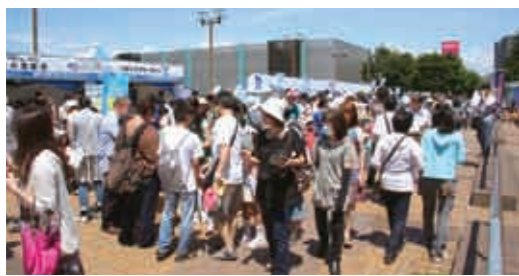
多くの来場者で盛り上がる 北総花の丘公園会場