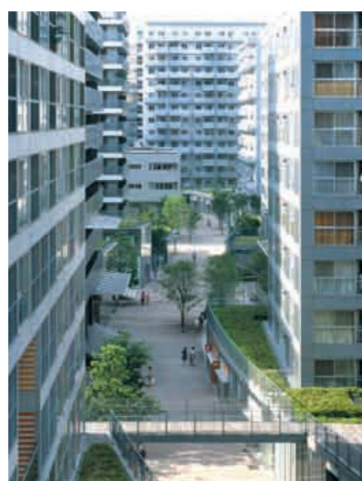
街区を縦断するS字アヴェニュー