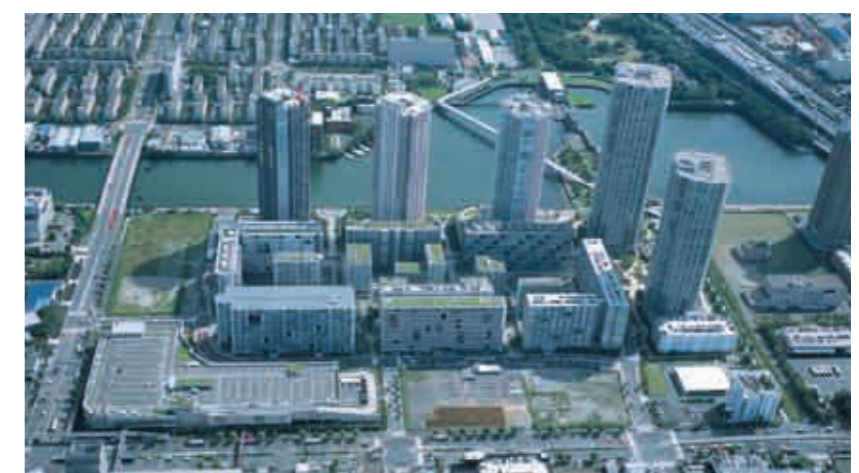
東雲キャナルコートCODAN(平成20年9月撮影)