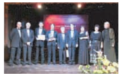
表彰式での機構代表団とリブコムアワード審査員

ついて、活動や取り組みをコーディネートしながらまちづくりを進める当機構の役割を、審査の評価項目に沿ってプレゼンしました。 施行者である機構と民間事業者だけでなく、住民や地域の市民団体そして地方自治体と連携してまちづくりに取り組むことで、質の高い生活環境を実現していることに高評価をいただきました。