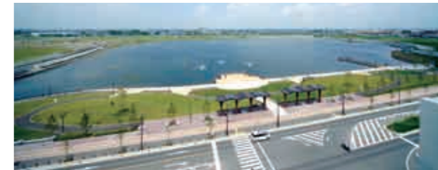
大規模（おおさがみ）調節池