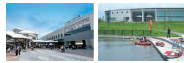
越谷レイクタウン駅 水辺で遊ぶ人々

事業名称: 越谷都市計画事業 越谷レイクタウン特定土地区画整理事業 施行者: 独立行政法人都市再生機構 所在地: 埼玉県越谷市相模町、大成町、川柳町、東町の各一部 施行面積: 約225.6ha 事業年度: 平成11年度～平成25年度(清算期間5年を除く) 総事業費: 約897億円 計画戸数: 約7,000戸 計画人口: 約22,400人(人口密度 約100人/ha)