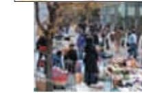
フリーマーケットの賑わい

UR シノメスタイル で 検索 してください。 http://www.ur-net.go.jp/machi/shinonome/