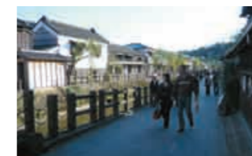
美しい小江戸の風景を一目見ようと観光客が訪れる