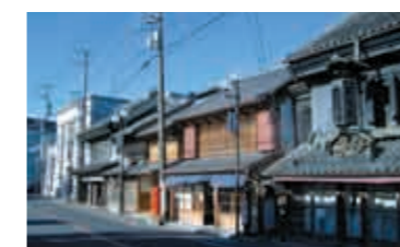
歴史的建造物が多く建ち並んでいる