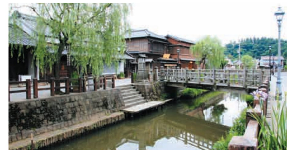
重要伝統的建造物群保存地区に選定された「北総の小江戸」ともいわれる佐原のまちなみ（小野川沿い）