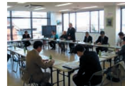
アドバイザーとの意見交換の様子

UR都市機構は、全国の市町村において、まちづくりのコーディネーターに取り組んでいます。市町村が魅力あるまちづくりを進めるためには、様々な課題を解決していかなければなりません。本制度は、それらの課題に対して、豊富な知識・経験を持った専門家とUR都市機構の職員が、まちづくりのアドバイスをさせていただきます。