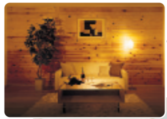
内装仕上げに自然素材を採用(杉板張りイメージ)

概要 所在地：東京都足立区新田3丁目19-37 交通：JR京浜東北線・東京メトロ南北線 王子 駅下車バス12分 ほか 戸数：215戸 建物構造：鉄筋コンクリート造11・14階建 平成18年12月入居予定(新築入居の募集は終了しています。)