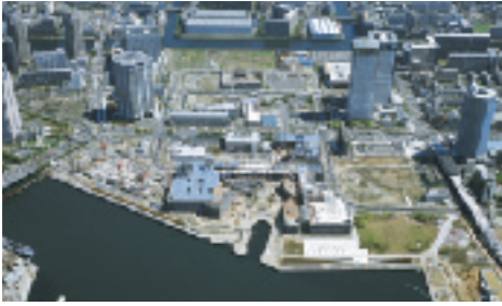
豊洲2・3丁目地区 航空写真(平成18年撮影)

芝浦工業大学豊洲キャンパスの開校をはじめ、豊洲2・3丁目地区の再開発も急ピッチで進んでいます。ITや新エネルギーなど、21世紀型産業を擁するビジネスエリアと商業エリア、そして住宅エリアなどが計画されています。