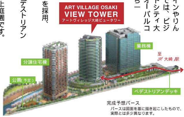
ART VILLAGE OSAKI VIEW TOWER アートヴィレッジ大崎ビュータワー

概要 所在地：東京都品川区大崎一丁目550番地 交通：J R 大崎 駅下車徒歩5分、J R 五反田 駅下車徒歩6分 戸数：329戸 建物構造：鉄筋コンクリート造28階・地下1階建 平成19年1月入居予定 新築入居の募集期間：平成18年10月28日～11月12日 お問合せ先：募集販売本部住宅営業第4チーム 03-3347-4326