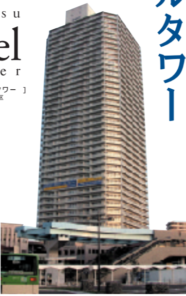
toyosu Ciel tower [豊洲シエルタワー] 東京都江東区

東京の新しいスタイルとなるウオーターフロント豊洲、その豊洲の中心に位置するのが「豊洲シエルタワー」です。周辺には、「スーパーバホーム豊洲店」や、「イオン東雲ショッピングセンター」などの大型商業施設、「豊洲文化センター」をはじめとした公共施設、「豊洲三丁目公園」、「豊洲公園」などの緑の潤いも整い、快適なアメニティを形成しています。また、10月には「アーバンドック」から「豊洲」もグランドオープンしました。