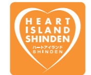
ハートアイランド新田三番街

荒川に向かってゆるやかな斜面は美しい水辺空間、洪水や地震にも強い「スーパー堤防」が安全で安心な親水空間と居住空間を創り出しました。一番街・さくら坂の照明は、北米照明学会の「国際照明デザイン賞」優秀賞を、UR都市機構として初めて受賞しました。