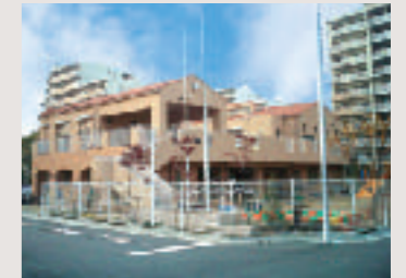
建替えによる整備敷地を活用した保育所の整備事例