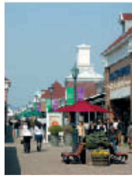
《表紙の風景》 佐野プレミアム・アウトレット (栃木県佐野市) 旧地域公園(現UR都市機構)が開発した佐野新都市の中核施設、日本を代表するアウトレットモールとして人気を集め、佐野の商圏を一挙に拡大した。平成18年3月にはさらに規模を拡大し、有名ブランドを充実させ話題を呼んでいる。

平成18年度においては、経営改善に向けた取り組みを引き続き着実に推進するとともに、