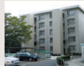
既存賃貸住宅への中層エレベーター設置事例

建替事業、ストック総合再生事業と一体的に、建替えによる整備敷地、既存施設等を活用して社会福祉機能の向上を図る事業