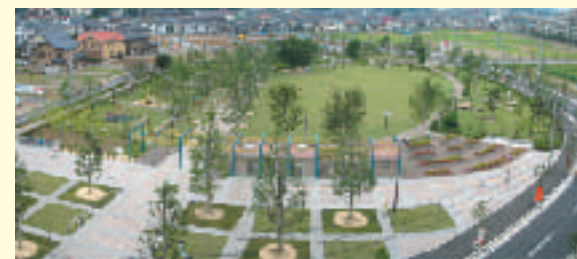
上福岡市西中央公園全景

主催 社団法人 日本公園緑地協会 受賞者 UR都市機構埼玉地域支社 西武造園株式会社 受賞地区 上福岡市西中央公園（埼玉県上福岡市） 受賞ポイント ・市民参加型プロジェクト ・総合的空間としての仕上がりの美しさ ・品質管理