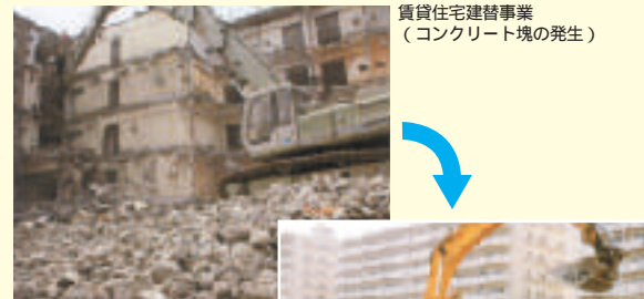
賃貸住宅建替事業（コンクリート塊の発生）

主催 3R推進協議会 受賞者 UR都市機構埼玉地域支社 UR都市機構神奈川地域支社 受賞地区 建替事業で発生するコンクリート塊による再生砕石の製造及び地区間利用 受賞ポイント 再生砕石の製造・現地再生及び 支社間利用により、環境負荷の低減を図れたこと