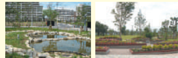
雨水を利用している池