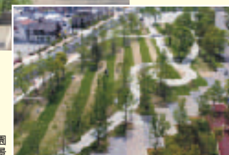
きたまちしましま公園 西側全景