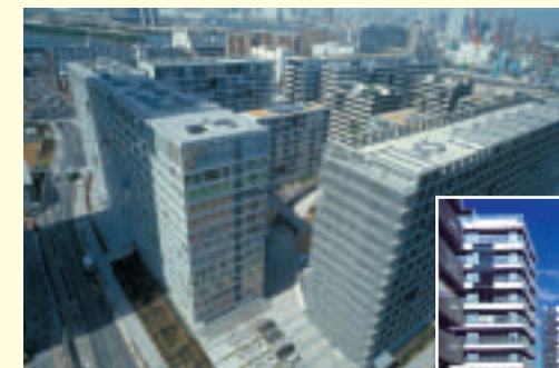
東雲キャナルコート中央ゾーン

主催 財団法人 日本産業デザイン振興会 受賞者 UR都市機構東京都心支社 東京建物株式会社 受賞地区 東雲キャナルコート中央ゾーン（東京都中央区） 受賞ポイント ・事業の各段階での関係者による実効性ある会議の実施プロセス ・外部に開かれた繋がりのある空間性 ・従来の団地イメージの刷新