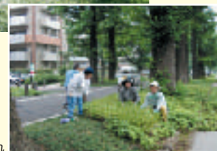
住民による手入れ