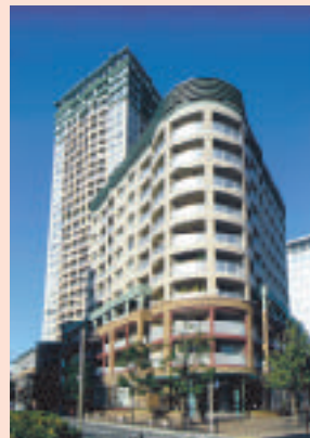
《表紙の風景》 オーバーコート大崎 （品川区） 先端企業の集積という地域特性を反映し、JR大崎駅東口に「大崎ニューシティ」を手始めに「ゲートシティ大崎」「オーバーコート大崎」など商業・業務・住宅を網羅した再開発が進捗、「第1次都市再生緊急整備地域」に指定されています。