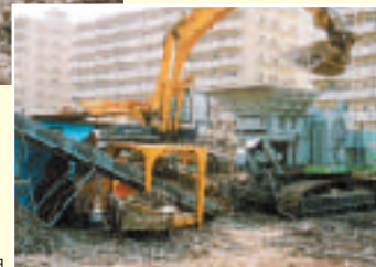
地区内にて製造、再利用