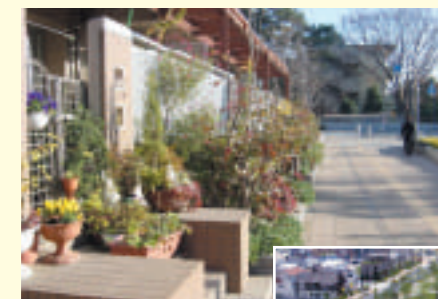
開放的なつくりのアーベイン大宮

主催 都市づくりパブリックデザインセンター 受賞者 さいたま市 スバル興産株式会社 UR都市機構埼玉地域支社 受賞地区 大宮北部拠点宮原地区（さいたま市） 受賞ポイント さいたま新都心に続く新都市としての新たな拠点づくり及びこれを実現する個々の計画、デザイン等