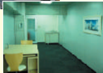
スモールオフィス（SOタイプ）オフィス（執務室）